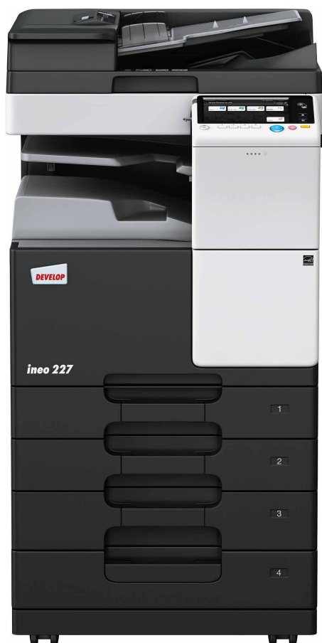
ineo 227 z podajnikiem dokumentów (DF-628), separator prac (JS-506) i podajnikiem papieru (PC-213)