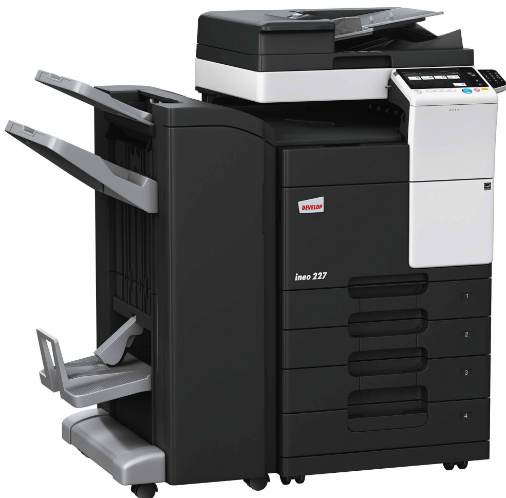
ineo 227 z podajnikiem dokumentów (DF-628), finiszerm do broszur (FS-534SD), podajnikiem papieru (PC-213) i klawiaturą numeryczną (KP-101)

Urządzenia monochromatyczne oferują szereg funkcji, które ograniczają zużycie energii. Oprócz oszczędności pieniędzy, funkcje te są również korzystne dla środowiska naturalnego i śladu węglowego.