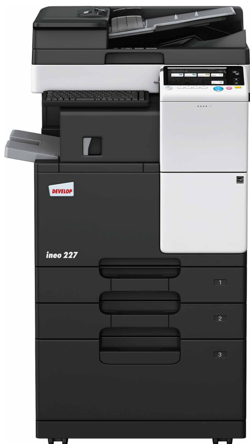
ineo 227 z podajnikiem dokumentów (DF-628), finiszerm wewnętrznym (FS-533), podajnikiem papieru (PC-413) i uchwytem klawiatury (KH-102)

Urzędy pracy, szkoły i uczelnie, firmy projektowe, architekci, firmy ubezpieczeniowe, banki, biblioteki - wiele małych i średnich firm tak naprawdę nie potrzebuje możliwości druku w kolorze. To, czego naprawdę potrzebują ci użytkownicy, to monochromatyczne urządzenia wielofunkcyjne, które zapewnią intuicyjną prostotę obsługi i łatwą mobilną użyteczność dla większej liczby pracowników biurowych.